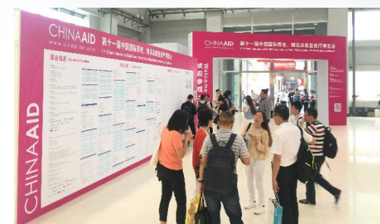
China Aid 开幕